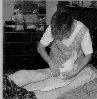
Die Spitex ist in die Reform der Pflege-Ausbildung eingebunden.

Um das Projekt HF Pflege zielgerichtet und effizient umzusetzen, hat die Regierung eine Koordinationsgruppe eingesetzt, in der alle Bildungspartner vertreten sind (Pflegeschulen, OdA, Spitäler, Heime, Spitex, Ausbildungs-