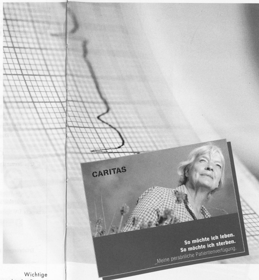
Wichtige ethische Fragen stellen sich am Lebensende: Wer entscheidet über lebenserhaltende Massnahmen?

Aber auch aus anderen Veränderungen entstehen neue ethische Dilemmasituationen: Spardruck, kulturelle Unterschiede sowohl beim Fachpersonal wie auch bei der Kundschaft, unterschiedliche Sichtweisen der verschiedenen Professionen und Zuständigkeitsprobleme, von denen gerade die Spítex oft besonders betroffen ist. Demenz, Patientenverfügungen