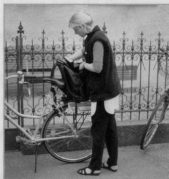
Die Betreuung durch Spitex ist je nach Kanton immer noch sehr unterschiedlich.

Gleichzeitig ist aber die Intensität der Betreuung unterschiedlich. Die Spitex-Dienste einiger Kantone mit vielen Klientinnen und Klienten (Neuenburg, Freiburg und Wallis) bieten diesen jährlich nur wenige Leistungen. Mit etwa 40 Stunden pro Jahr gehören diese Klientinnen und Klienten zu