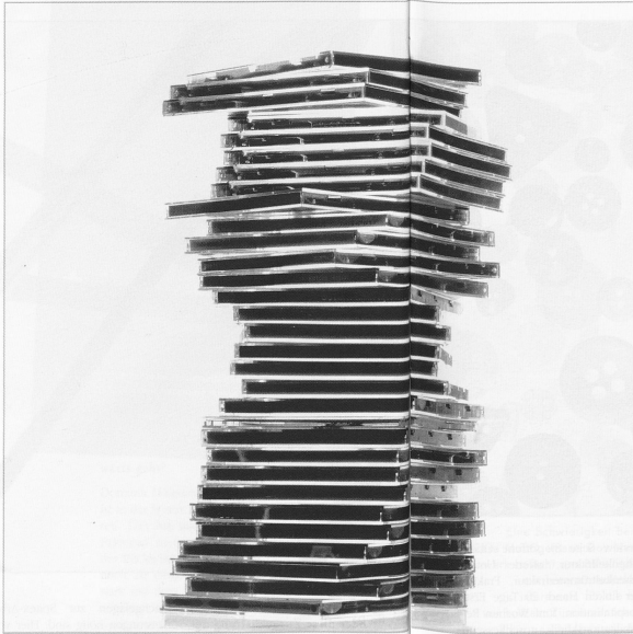
Eine wichtige Voraussetzung für Case Management ist eine gute Dokumentation der eigenen Arbeit mit einer EDV-Lösung.

Ich sehe, wie gesagt, das größte Problem in der Tatsache, dass alle auf alle warten. Stattdessen wäre es wichtig, vorausschauend und innovativ zu handeln, indem man die eigene Spitex-Organisation unter die Lupe nimmt und analysiert, wo Case Management als Methode eingesetzt werden kann. Und vielleicht würde man für ein Pilotprojekt sogar beim Kanton, bei der Gemeinde oder beim Bundesamt für Gesundheit auf offene Ohren stossen. □