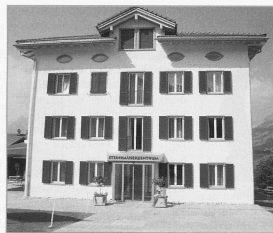
Alterswohnungen in Obersaxen: mit Spitez als zweckmässiger und wirtschaftlicher Lösung.