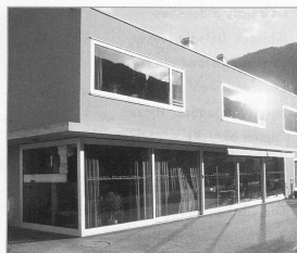
Pflegewohngruppe in der Gemeinde Vals: Die Führung wurde der Spitez übertragen.

Organisation übergeben werden soll. Der Entscheid fiel klar zu Gunsten der Spitez aus. Die Führung der Pflegewohngruppe ist in der Folge der Spitez übertragen worden. Mit einer Vereinbarung zwischen der Gemeinde Vals und der Spitez Foppa ist der Auftrag über die Führung geregelt worden. 15 der insgesamt 58 Mitarbeiterinnen der Spitez Foppa sind heute in der Pflegewohngruppe im Einsatz.