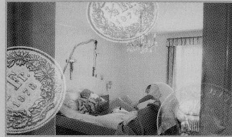
Die Verordnung legt u. a. fest, wer Anspruch auf Leistungen hat.

Die Tarifordnung für Organisationen der häuslichen Pflege und Betreuung, das Reglement für den Austausch von Pflege- und Betreuungskräften und den Einsatz von überregionalen Organisatio-