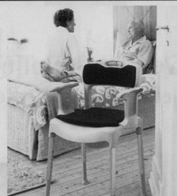
Nachtstuhl SWIFT Commode

bimeda® Leichter durch den Alltag Produkte für mehr Lebensqualität