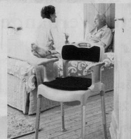
Nachstuhl SWIFT Commode

bimeda® Leichter durch den Alltag Produkte für mehr Lebensqualität