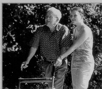
Die Gesundheits- und Fürsorgedirektion finanziert die Ausbildungsleistungen der Betriebe mit zweckgebundenen Pauschalen.

Die Gesundheits- und Fürsorgedirektion GEF finanziert die Ausbildungsleistungen der Betriebe mit zweckgebundenen Pauschalen und stellt zudem Instrumente und Hilfsmittel zur Verfügung, um den Betrieben die Ausbildungsaufgabe zu erleichtern. Die Hilfs-