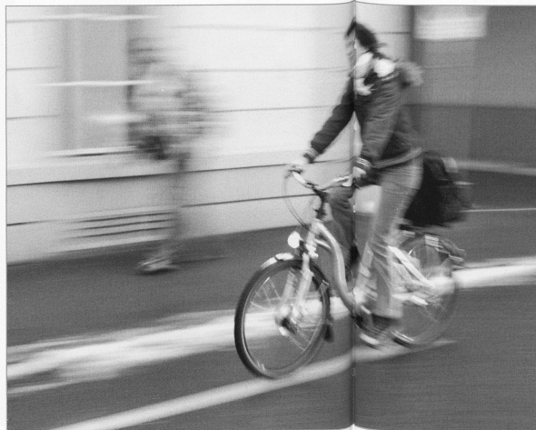
Wie stark die Spitez-Versorgung ausgebaut ist, hängt von der Pflegestrategie der Kantone ab. Das Stadt-Land-Schema scheint dabei keine Rolle zu spielen.

Der Ärztemangel auf dem Land ist in aller Munde. Eine Untersuchung des schweizerischen Gesundheitsobservatoriums zeigt jedoch: Nur in wenigen Regionen droht tatsächlich der Notstand. In Appenzell Innerrhoden und Nidwalden gibt es 0,4 Hausärzte/Hausärztinnen pro 1000 Einwohnerinnen und Einwohner - der landesweite Durchschnitt liegt bei 0,61. Andere Landkantone dagegen sind komfortabel dran: In Glarus gibt es 0,71 Hausärzte pro 1000 Einwohner, in Graubünden sogar 0,73. Zu schaffen macht der Hausärzteschaft auf dem Land eher der Mangel an Spezialistin-