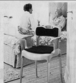
Nachtstuhl SWIFT Commode

bimeda Leichter durch den Alltag Produkte für mehr Lebensqualität