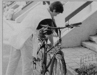
Die Spitex im Kanton St. Gallen ist gefragt.

Die 69 Spitex-Organisationen betreuten 2007 insgesamt 11'527 Klientinnen und Klienten und ver-