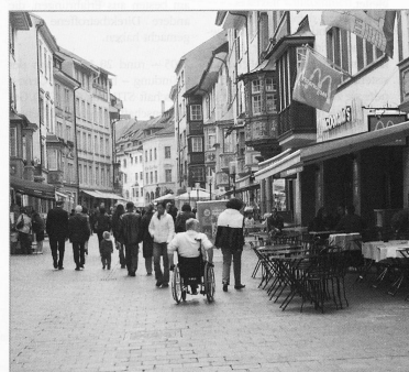
Langsam setzt sich auch in der Schweiz die Einsicht durch: Für den Umgang mit ihrer Behinderung sind die Betroffenen selber Expertinnen und Experten.

auf, dass ein Assistenzbudget aus der Sicht der Menschen mit einer Behinderung das gesetzte Ziel erreicht. Insbesondere in den Bereichen Haushaltführung, Bildung, Arbeit, Freizeit und soziale Kontakte erlangen sie deutlich mehr Selbstbestimmung und Selbständigkeit. Angehörige können entlastet und Heimeintritte können verzögert oder verhindert werden.