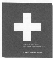
Die Broschüre kann ab Internet unter www.bsv.admin.ch heruntergeladen oder kostenlos bestellt werden.

Das Bundesamt für Sozialversicherungen hat gemeinsam mit dem Schweizerischen Arbeitgeberverband und dem Schweizerischen Gewerbeverband eine Broschüre für Arbeitgebende herausgegeben. Der Ratgeber zeigt die Neuerungen der 5. IV-Revision und die konkreten Dienstleistungen der IV auf.