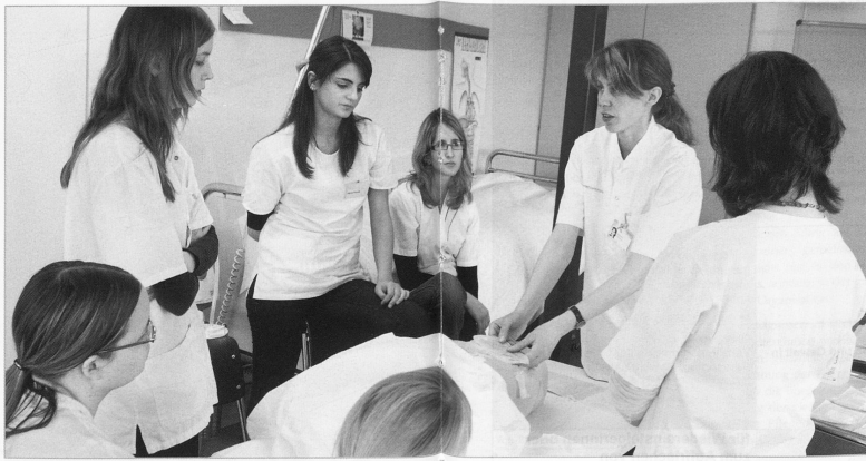
Damit Fachkräfte im Gesundheitswesen die steigende Versorgung von Menschen mit chronischen Krankheiten gewährleisten können, müssen sie gut auf diese Aufgaben vorbereitet werden.

Diese Kernkompetenzen ermöglichen es klinisch tätigen Fachkräften den Gesundheitsversorgungsbedürfnissen von Menschen mit chronischen Krankheiten besser Rechnung zu tragen.