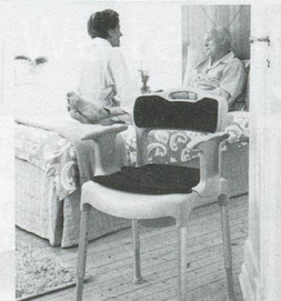
Nachtstuhl SWIFT Commode

Leichter durch den Alltag Produkte für mehr Lebensqualität