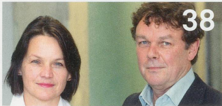
Spitex-Fusionen in der Stadt Zürich