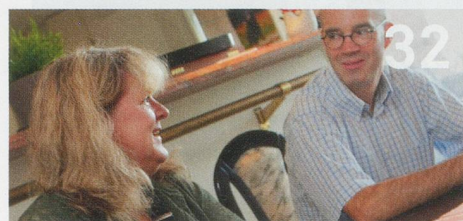
Ein Spitaldirektor auf Spitex-Tour