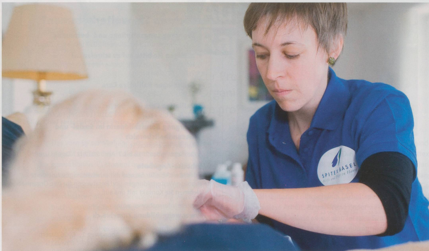
Allzeit bereit: Mitarbeiterin des Basler Spitexpress-Notfalldiensts packt für den Einsatz.

soll sich durch den Spitexpress gut versorgt und sicher fühlen», fasst Karin Wiedmer zusammen.