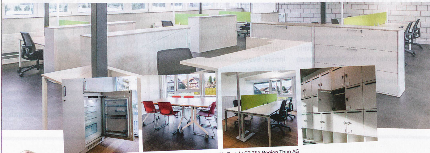
iba in Zusammenarbeit mit Haworth: Projekt SPITEX Region Thun AG