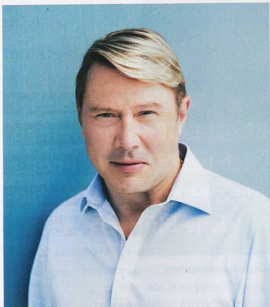
Formel-1-Champion Mika Häkkinen trägt Hörgeräte von Neuroth

Eine Hörminderung kommt meistens schleichend. Umso wichtiger ist es, sich rechtzeitig helfen zu lassen. Das weiss auch Formel-1-Legende Mika Häkkinen, der selbst Hörgeräte trägt und auf das Know-how von Neuroth setzt. Als Hörbotschafter will er auch anderen Menschen mit Hörminderung Mut machen.