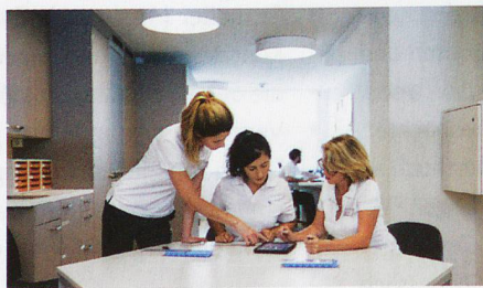
Das Tertianum Pflegepersonal bei der Arbeit mit der mobilen Pflegedokumentation careCoach.

Ende 2017 konnte die erste Phase erfolgreich abgeschlossen werden – 32 Betriebe wurden auf careCoach umgestellt und die Pflegemitarbeitenden in deren Anwendung geschult.