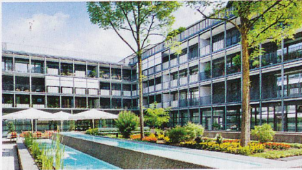
Tertianum Residenz Huob in Pfäffikon/SZ

Es war vor vier Jahren an der IFAS, als zwei Delegierte der Tertianum Gruppe sich nach neuen Pflegedokumentations-Lösungen umsahen. Im Januar 2015 wurde beschlossen, careCoach im neu eröffneten Betrieb «Tertianum Vitadomo Bubenholtz» in Opfikon einzusetzen.