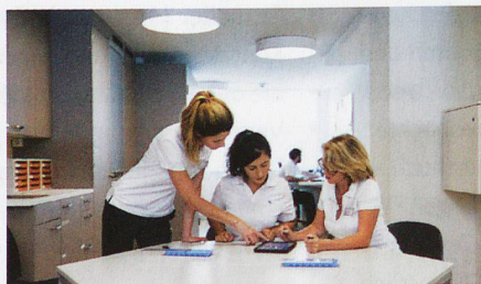
Das Tertianum Pflegepersonal bei der Arbeit mit der mobilen Pflegedokumentation careCoach.

Ende 2017 konnte die erste Phase erfolgreich abgeschlossen werden – 32 Betriebe wurden auf careCoach umgestellt und die Pflegemitarbeitenden in deren Anwendung geschult.