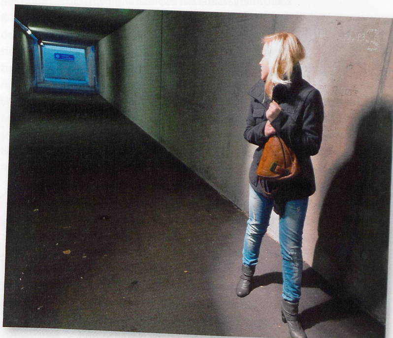
Auf dem Arbeitsweg bei Nacht ist vielen Mitarbeitenden der Spitex mulmig zumute.

Die Spitex Stadt Luzern sorgt mit unterschiedlichen Massnahmen und Hilfsmitteln für mehr Sicherheit in der Nacht. Fühlt sich ein Nachtdienstler unsicher, darf er einen zusätzlichen Mitarbeitenden anfordern, den Einsatz abrechnen und später ausführen – oder im Notfall sogar die Polizei beiziehen. Fehlen Lichtquellen, sorgen die Vorgesetzten zudem für eine Optimierung der Situation. «Manchmal gibt es einen anderen Hauszugang, manchmal muss eine zu-