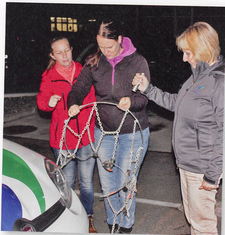
Das Schneeketten-Montieren will gelernt sein.