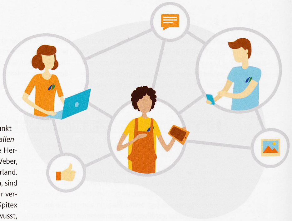
Interne Kommunikation ist bei der Spitex von zentraler Bedeutung.

Dies ist von besonderer Bedeutung, weil die Spitex Bachtel AG 2016 aus der Zusammenlegung von vier Spitex-Vereinen hervorging. «Die Plattform beschleunigt den herausfordernden Prozess, dass sich alle Mitarbeitenden mit der neuen Organisation identifizieren. Zum Beispiel,