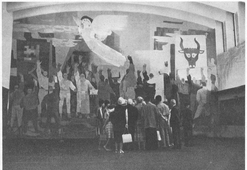
Hier bewundern sie das grosse Wandgemälde Clénins - Ils admirent ici la grande peinture murale de Clénin.

«Home» pour Suisses de l'étranger... un pied-à-terre dans la patrie