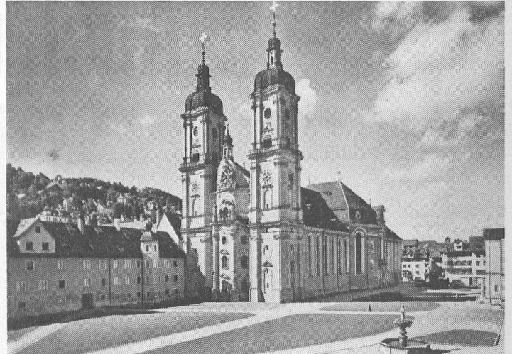
Klosterkirche St. Gallen. – L'église du cloître de St-Gall.

Nos hôtes du «Home» avec la «Flèche rouge» des CFF à la journée des Suisses de l'étranger à St-Gall