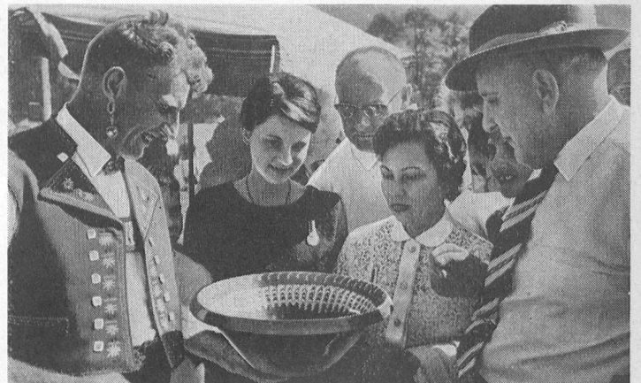
«Äpler-Chilbi» auf dem Festplatz in St. Gallen. – Fête folklorique à St-Gall.