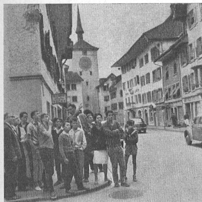
Im historischen Mellingen (Aargau). – La cité historique de Mellingen (Argovie)