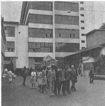
Besuch der Wellfirma Brown, Boveri & Co., Baden (Aargau). – Visite de la célèbre fabrique BBC à Baden (Argovie).