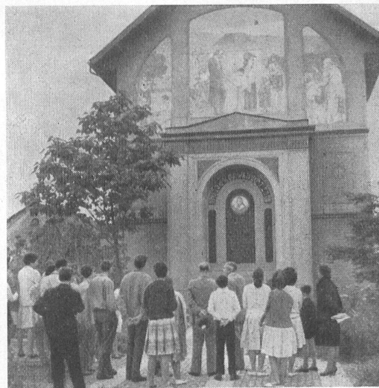
Vor dem Grabdenkmal Pestalozzis (1746–1827 in Birr (Aargau). – Devant le monument funéraire de Pestalozzi (1746–1827) à Birr (Argovie).

Heimatkundliche Exkursionen unter fachpädagogischer Führung – Excursions à la découverte de la mère patrie sous la conduite de pédagogues compétents