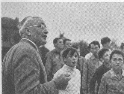
Kunsthistorische Studien in der Klosterkirche Muri (Aargau). – Contemplation artistique dans l'église du vieux cloître de Muri (Argovie).