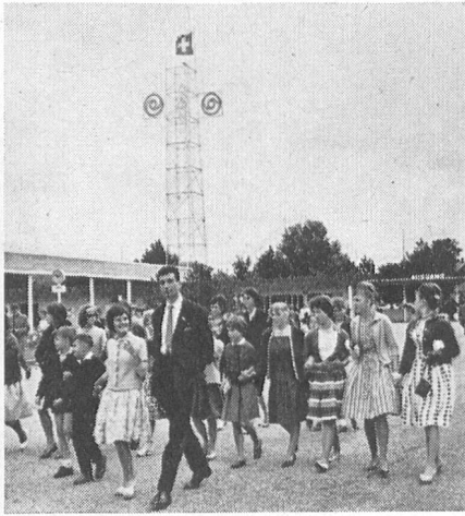
Besuch der Ausstellung HYSPA (Hygiene und Sport) in Bern. – Visite de l'HYSPA (hygiène et sport) à Berne.