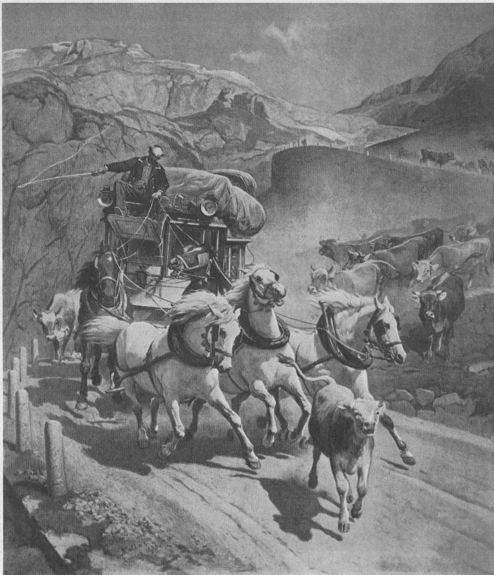
Rudolf Koller 1828–1905

Trinkgelder und Fremdentaxen kommen nicht in Anwendung. Persönliche Wünsche und andere Extradienste werden zu Selbstkosten berechnet. Preisänderungen vorbehalten.