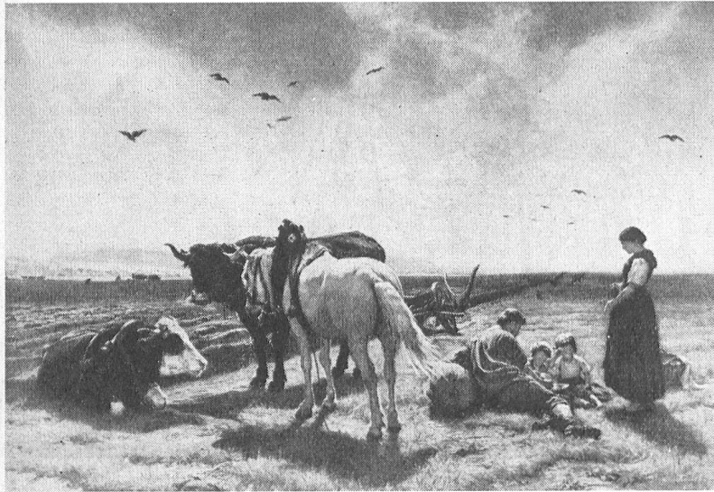
Rudolf Koller, Zürich, 1828–1905: Mittagsrast auf dem Felde. Museum Luzern

Das wären einige Stellen aus den Büchern Rousseaus, die uns Einblicke in sein Denken und Fühlen gewähren. Vergessen wir nicht, dass die grossen Schweizer des 18. Jahrhunderts, welche vor zweihundert Jahren im Bad Schinznach die Helvetische Gesellschaft gründeten, für Rousseau eine grosse Verehrung und Freundschaft empfanden. Sie fühlten sich ihm geistig verwandt. Der Basler Iselin, die Zürcher Lavater, Hess, Usteri, Füssli und Escher von der Linth, der Brugger Zimmermann, die Berner Tschiffeli, Tschanner und Fellenberg, der Appenzeller Zellweger bekundeten in ihrem Briefwechsel grosses Interesse für ihn. Einige besuchten ihn oder machten sogar ihre Hochzeitsreise zu ihm ins Val de Travers. Unter Rousseaus Einfluss kam der junge Pestalozzi auf den Gedanken, auf dem Birrfeld als Bauer und Erzieher neue Wege zu gehen. Auch Schiller, der Verherrlicher der menschlichen Freiheit, bekam