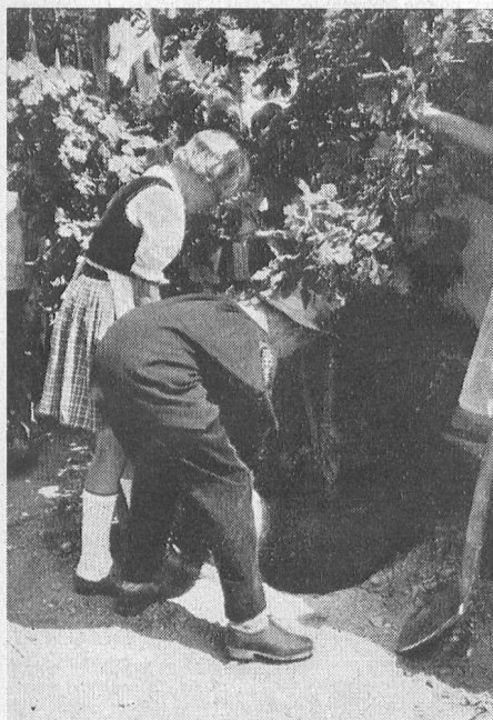
Die Schweizer Jugend pflanzt eine Erinnerungseiche und überbringt Erde aus jedem Kanton. – La jeunesse suisse plante un chêne et dépose de la terre de leur canton.