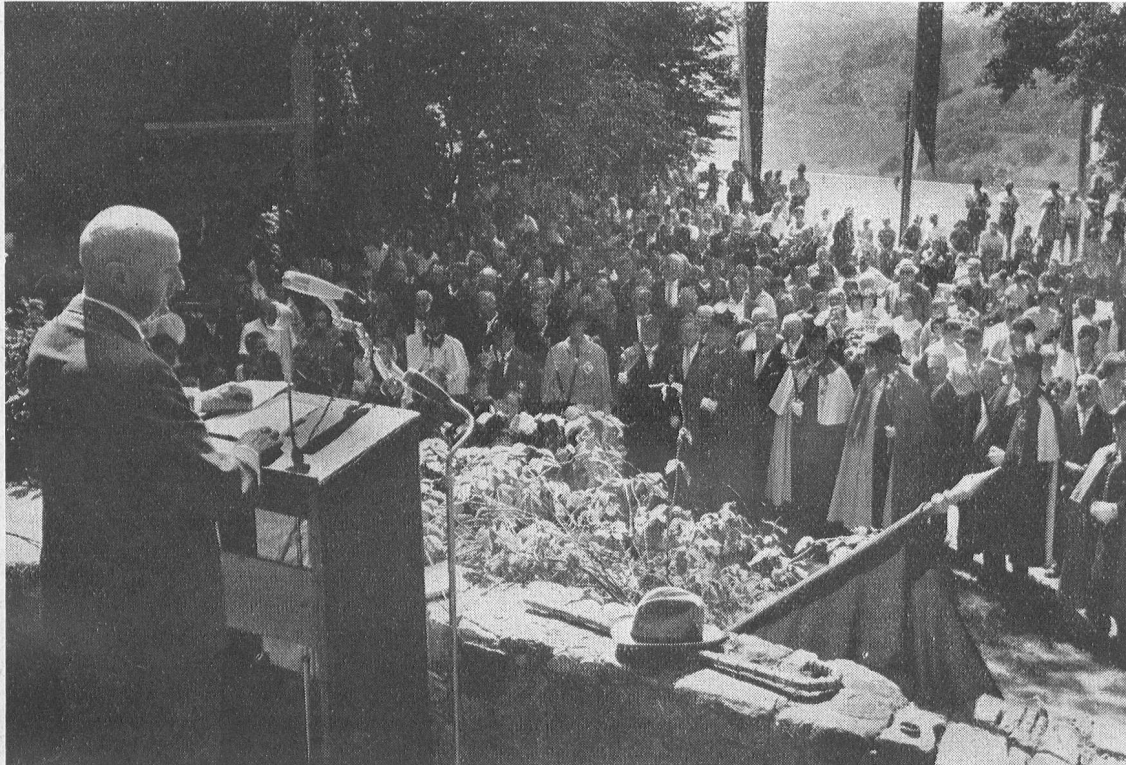
An der 25-Jahr-Feier Hohle Gasse (Küssnacht a/R) sprach alt Bundesrat Dr. h. c. Philipp Etter in begeisterten Worten zur Schweizer Jugend. Im Hintergrund (rechts) unsere über 100 Auslandschweizer-«Home»-Gäste, die er in französischer Sprache begrüßte. – M. Philippe Etter, ancien conseiller fédéral, s'adressant à la jeunesse suisse à l'occasion de la Fête nationale et du 25 e anniversaire du fameux «Chemin Creux» de Küssnacht/Righi. Au fond (à droite) plus de 100 hôtes de notre «Home» auxquels il souhaita la bienvenue en langue française.

Schweizer Jugend in der Hohlen Gasse in Küssnacht a/Rigi