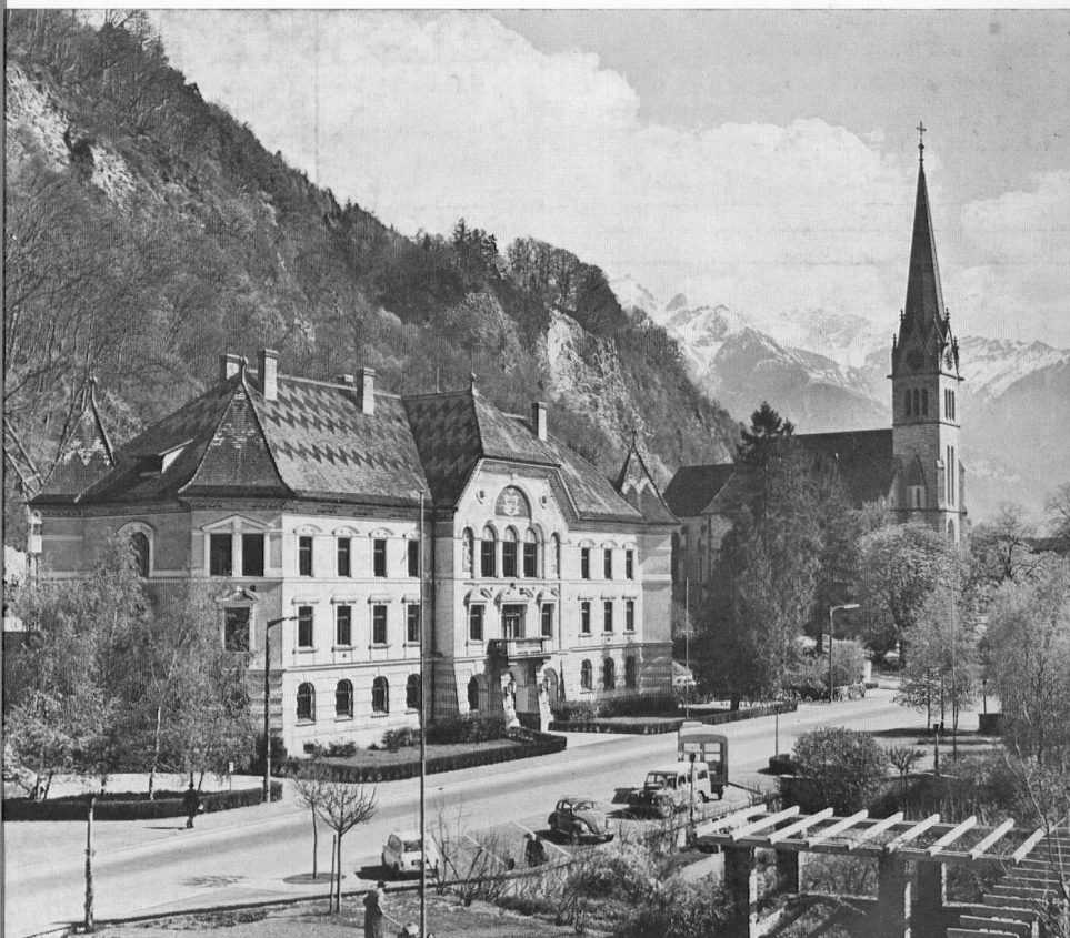
Regierungsgebäude in Vaduz