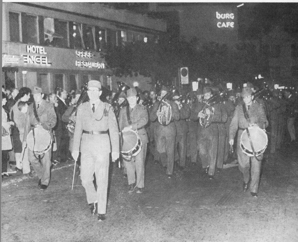
Das Spiel des Infanterie-Regimentes 72 in Vaduz