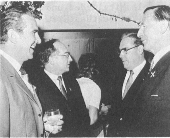
Herr alt Bundesrat Dr. L. von Moos anlässlich unserer Bundesfeier im Jahre 1972