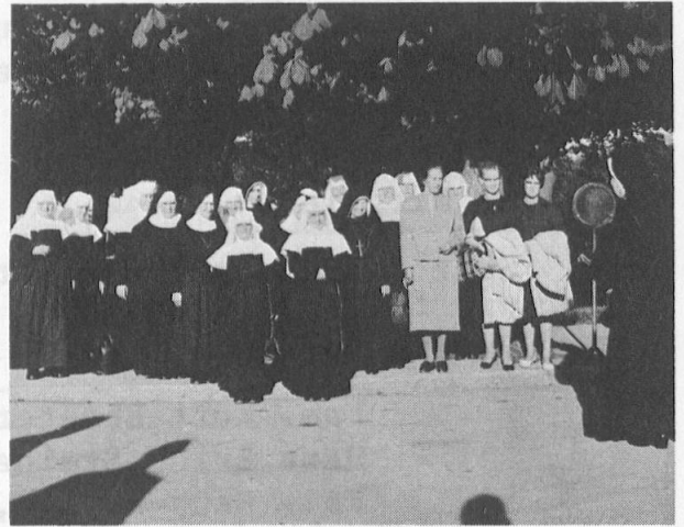
Ein Ausflug mit allen Krankenschwestern und Kindergärtnerinnen aus Liechtenstein nach Einsiedeln, organisiert durch den Schweizer-Verein