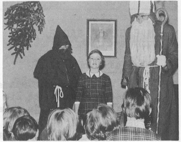
Der Samichlaus anlässlich einer Chlausfeier des Schweizer-Vereins