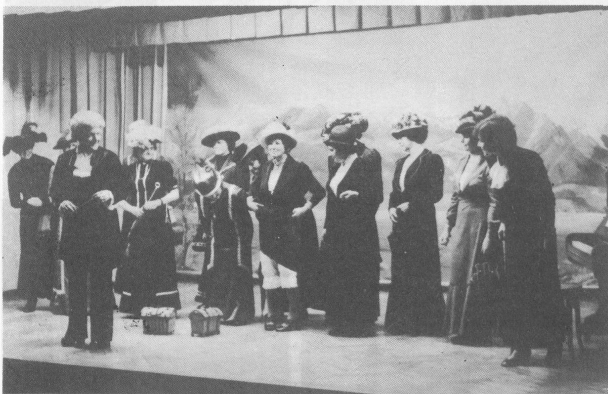
Der Nostalgiechor Sirnach TG, auch genannt "Die Lustigen Weiber von Sirnach", in ihren Kleidern "aus Grossmutter's Zeiten", ihren nostalgischen Liedern und ihren ulkigen Auftritten.