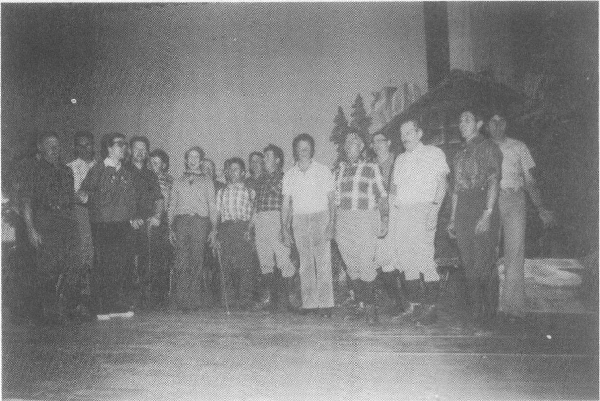
Bild unten: Wiedersehen an der Jubiläumsfeier "alter und ehemaliger Mitglieder aus der Gründungs- Zeit".