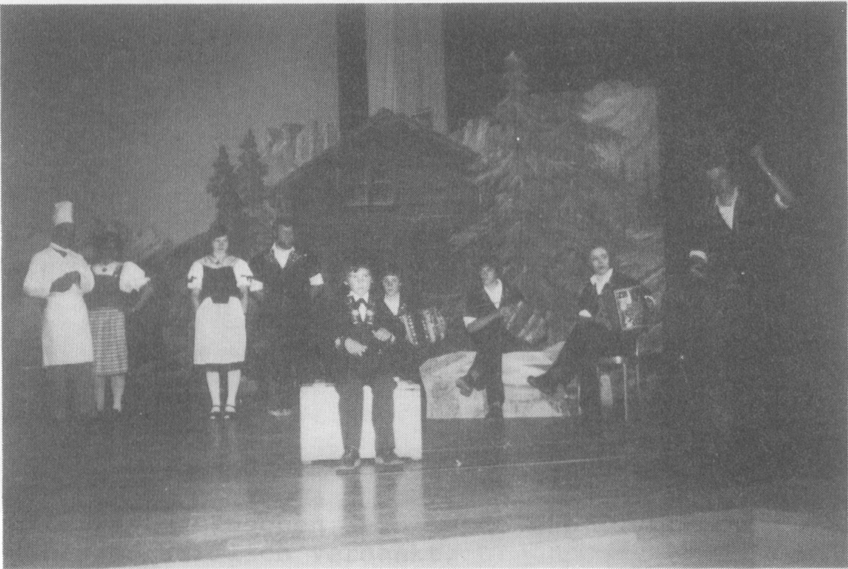
Anschließend lud Präsident Stettler die Ehren Gäste zu einer... (The text is mirrored and difficult to read due to the image's orientation and the page's bleed-through.)