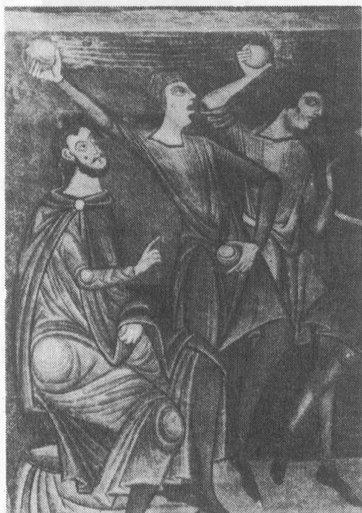
Romanische Malereien in der Klosterkirche von Münster

Das schweizerische Recht kommt nur zur Anwendung, wenn das ausländische Wohnsitzrecht nicht anwendbar ist. Eine Ausnahme besteht bezüglich der in der Schweiz gelegenen Liegenschaften,