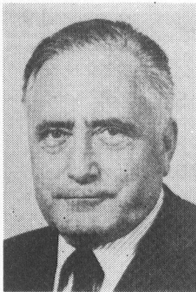
Bundespräsident G.A. Chevallaz

Historischer Geburtstage zu gedenken, ist nicht ganz problemlos. Die Gefahr, die Vergangenheit im Lichte heroischer und ruhmreicher Taten zu würdigen, ist nicht zu übersehen. Sie zeigt sich darin, dass wir uns mit einer weit zurückliegenden Vergangenheit zudecken und uns ohne grosse Bedenken mit den Vorfahren identifizieren, dabei aber die Gegenwart und die Probleme, die uns diese aufgibt, übergehen.