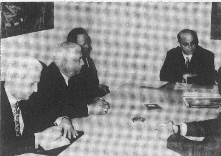
Im Gespräch mit Minister Maurice Jaccard, Auslandschweizerdienst beim DAA