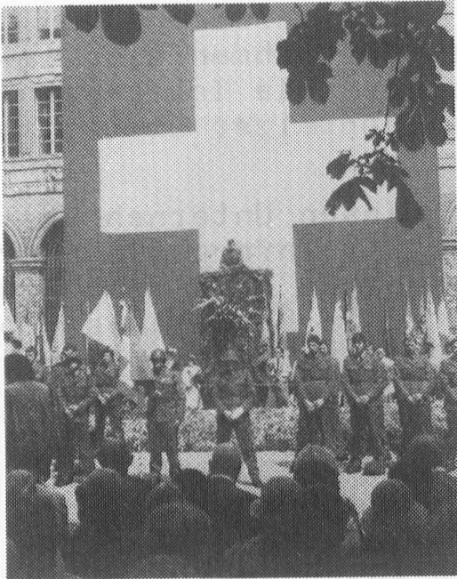
Eine 1. August-Feier

zerpolitik des Bundesrates vorzubereiten und die Koordination auf diesem Gebiet zwischen den einzelnen Bundesstellen und anderen Institutionen, die sich mit den Auslandschweizern befassen, herzustellen.