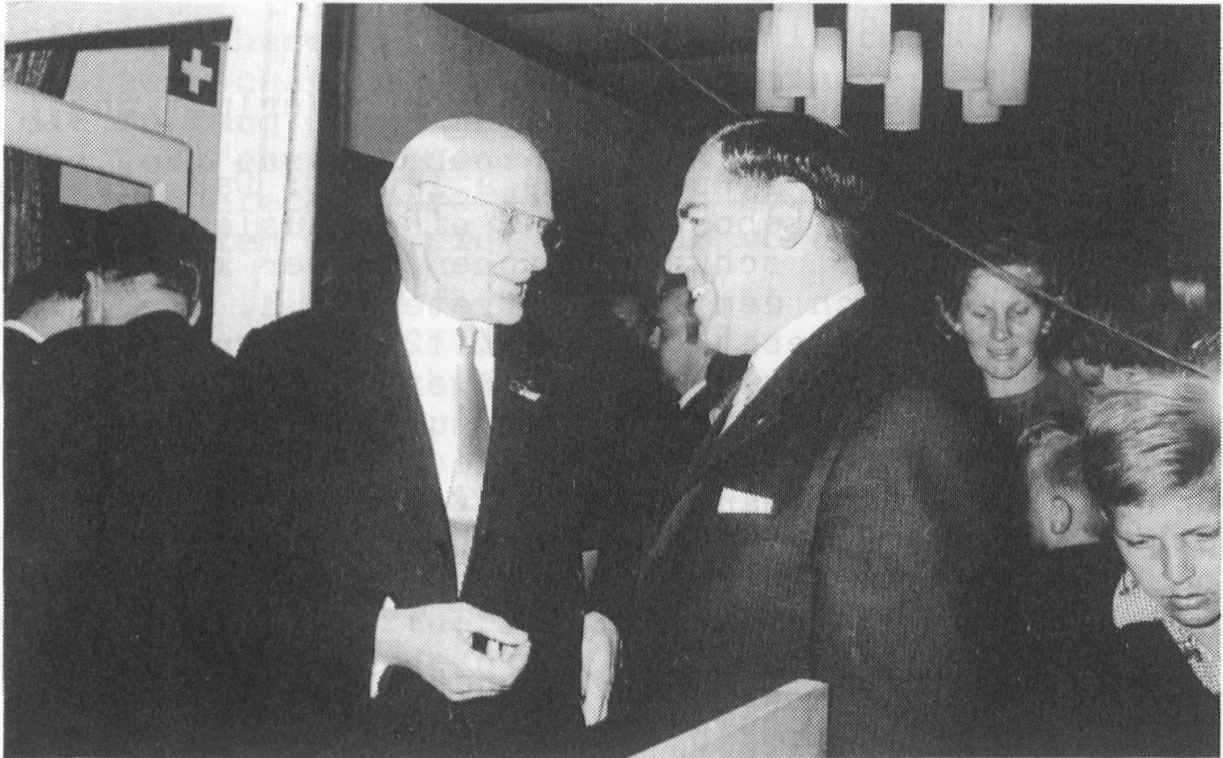
a.Bundesrat F.T.Wahlen mit dem damaligen Präsidenten des Schweizer-Vereins W.Stettler

Begegnung mit a.Bundesrat Prof.Dr.F.T.Wahlen, anlässlich der Bundesfeier des Schweizer-Vereins vom 1.August 1966 in Vaduz