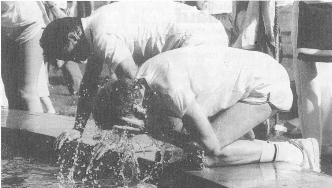
Abkühlung am Ziel.