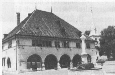
Hôtel des six communes, Môtiers.

Der Heimatschutztaler 1987 wird für das Neuenburger Jura-dorf Môtiers im Val de Travers rollen. Mit Unterstützung des Verkaufserlöses sollen nun rund 30 Häuser restauriert werden. Über drei Jahre lang – 1762 bis 1765 – lebte hier der Philosoph Jean-Jacques Rousseau. Môtiers ist heute noch so wie zur Zeit Rousseaus ein Dorf wie aus dem Bilderbuch.