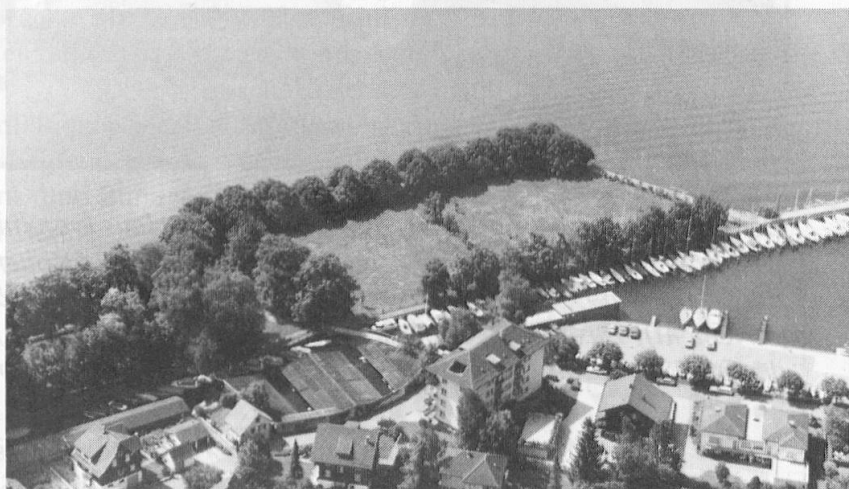
Der künftige Auslandschweizer-Platz am See in Brunnen.

■ Weiterhin ungebrochener Trend aufs Land : Auch 1986 wuchs die Schweizer Bevölkerung in ländlichen Gebieten stärker als in den Agglomerationen.