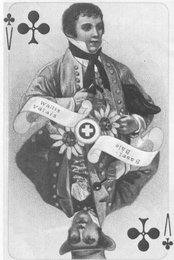
Kreuz-Bube aus dem Kartenspiel «La Suisse historique».

Selbstverständlich auch vom Buben, unter dem man in alten Schwänken gern den listigen (bübischen) Berater an den Fürstenhöfen verstand. Man nannte diese dritte Bildkarte auch etwa den Bauern. Man begriff darunter, zumindest nach einer an-