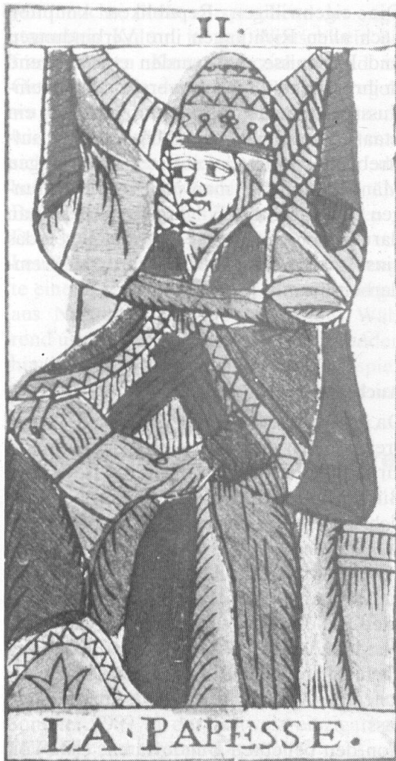
Päpstin-Karte eines Tarotspiels um 1760.