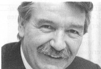
René Felber, Bundesrat:

Der Platz der Auslandschweizer ist auch ein Symbol für die Aussenpolitik.