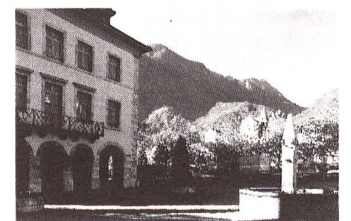
Vouvry VS

Heimat zum Ort der Versorgung im Notfall erklärte, hat vielen Menschen Schwierigkeiten gemacht und diese Heimat