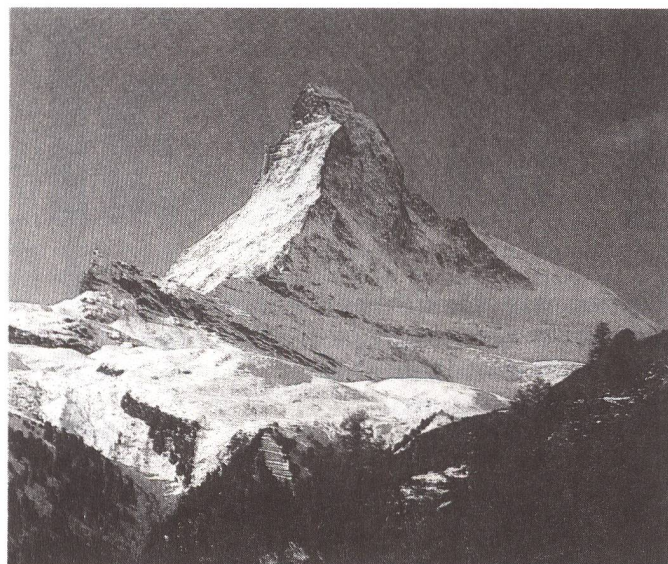
Der Blickwinkel ist entscheidend, denn man kann alles von mindestens zwei Seiten aus betrachten... Das Matterhorn von Italien (links) und von der Schweiz aus gesehen.

sicherten – Ruf, nicht viel zu reisen, in Geografie schlecht bewandert und mit Fremdsprachen wenig vertraut zu sein.