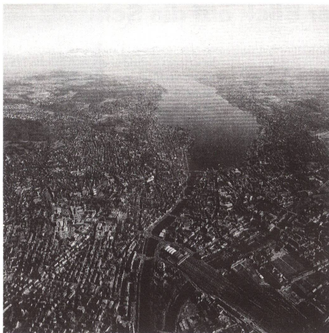
Für den Brasilianer Gideon Rosa die schönste Stadt Europas: Zürich.

FL-9490 Vaduz, Städtle 44, Postfach 384 Telefon 075 · 6 88 11, Telex 889 400