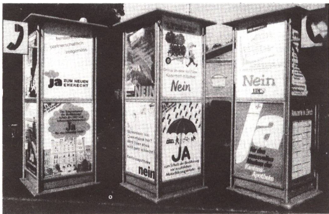
Dutzende kommunale, kantonale und eidgenössische Vorlagen pro Jahr: die direkte Demokratie als typisch schweizerische Form der Demokratie des Alltags.

fasziniert ist. Ich habe von mehreren Gesprächspartnern gern die Erklärung vernommen, Initiative und Referendum seien ein hervorragendes Mittel zur Kontrolle der Exekutive, und auch über der Legislative schwebende, dem Schwert des Damokles gleich, die Möglichkeit einer Volksabstimmung. Die Macht werde einerseits begrenzt, andererseits entstehe so Gelegenheit, alles stets von neuem zu überdenken, so dass extreme Lösungen verhindert würden. Mag sein, dass die schweizerische Innenpolitik, von aussen gesehen, deshalb etwas eintönig erscheint.