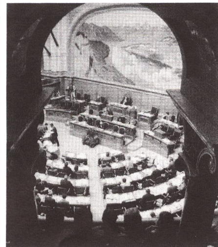
Die schweizerische Innenpolitik: aus ausländischer Sicht manchmal etwas «langweilig», dafür selten zu extremen Lösungen neigend. (Unser Bild: Nationalratssaal.)

che Kooperationen über osteuropäische Grenzen hinweg nur äusserst mühsam, obwohl sie bitter nötig wären. Vom Eigentümerbewusstsein über das System der Volksbefragung und die kantonale Eigenständigkeit sind wir so zur regionalen Zusammenarbeit und zu Europa gekommen. Die Schweizer Mechanismen geben dem ostmitteleuropäischen Beobachter gleichsam einen Kompass in die Hand. Dessen Nadel zeigt innerhalb des Landes in die Richtung sich frei organisierender kleiner Gemeinschaften und ausserhalb der Grenzen in die eines Europa, das die Blöcke abzubauen sucht und in dem mit grosser Autonomie ausgestattete Regionen miteinander in Kooperation stehen. Die Schweiz bleibt ausserhalb der EG, doch baut sie mit den Zwölf engste wirtschaftliche Kontakte aus, was aus ungarischem Blickwinkel besonders lehrreich ist: Der Beitritt kann aus politi-