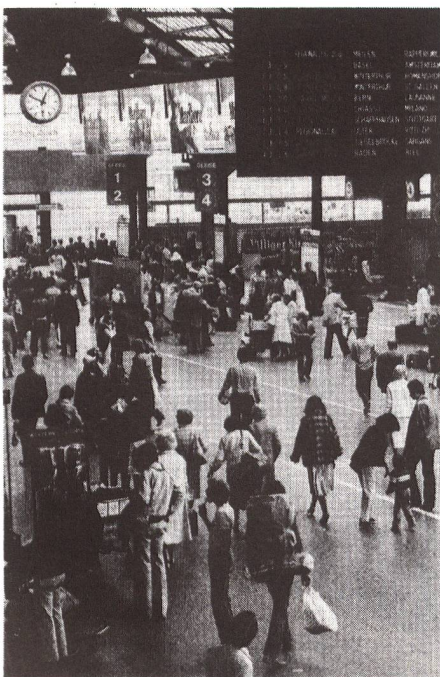
Die Pünktlichkeit der Schweizer Bahnen: für viele Ausländer ein erstaunliches Phänomen.

Zürich ist für mich die schönste Stadt Europas. Wirklich. Mir gefallen die gutangelegenen, scheinbar sorglos herumschlendernden jungen Pärchen, die man bei gutem Wetter an der Seepromenade antreffen kann. Mir gefällt das Stadtbild der schweizerischen Wirtschaftsmetropole – auch wenn die Einheimischen über den überbor-