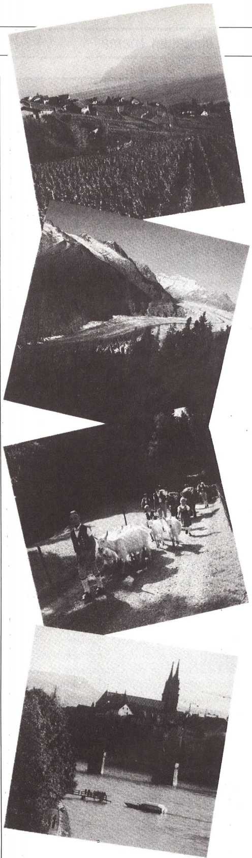
Die (schönen) Klischees der touristischen Schweiz: idyllische Landschaften, erhabene Bergwelt, folkloristische Landwirtschaft, reizvolle Städte. (Von oben: Lavaux am Genfersee, Aletschgebiet im Wallis, Alpbefahrt im Appenzellerland, Basel mit Mittlerer Brücke über den Rhein.)

Die Schweiz ist jedoch vielfältig. Administrativ und kulturell gesehen ist das sogar ihre Eigentümlichkeit. Der im 19. Jahrhundert entstandene Mythos der Berge gilt, streng genommen, nur für einen Viertel des Landes. Ist das französische Publikum zu wenig neugierig, oder haben jene kein Interesse, die sich mit der Information dieses Publikums befassen? Diese beiden Gründe sind nicht von der Hand zu weisen. Kenntnisse über das Ausland sind nicht die Hauptsorge der Franzosen, dies schon seit langem. Darüber hinaus stehen sie im – statistisch ge-