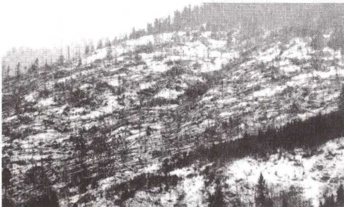
Sturmschäden im Kanton Glarus: Ganze Bannwälder liegen am Boden.