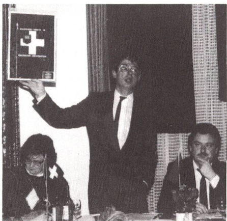
Die Würfel sind gefallen: Das Modell unserer neuen Vereinsfahne wird vorgestellt.