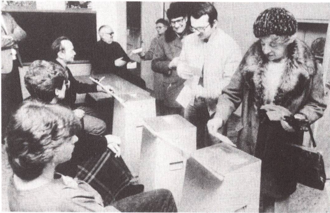
Auslandschweizer werden sich nicht mehr persönlich an die Urne begeben müssen.

Der Bundesrat hat am 15. August 1990 den Entwurf zur Revision des Bundesgesetzes über die politischen Rechte der Auslandschweizer und somit zur Einführung des Korrespondenzstimmrechts vom Ausland her verabschiedet.